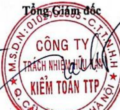
Nguyễn Chí Thành