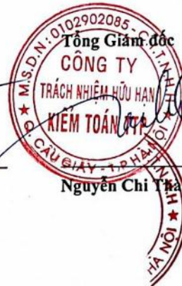
Nguyễn Chí Thành