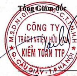
Nguyễn Chí Thành